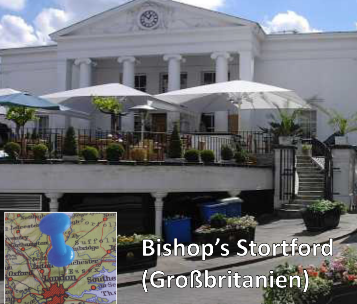
Bishop's Stortford (Großbritannien)